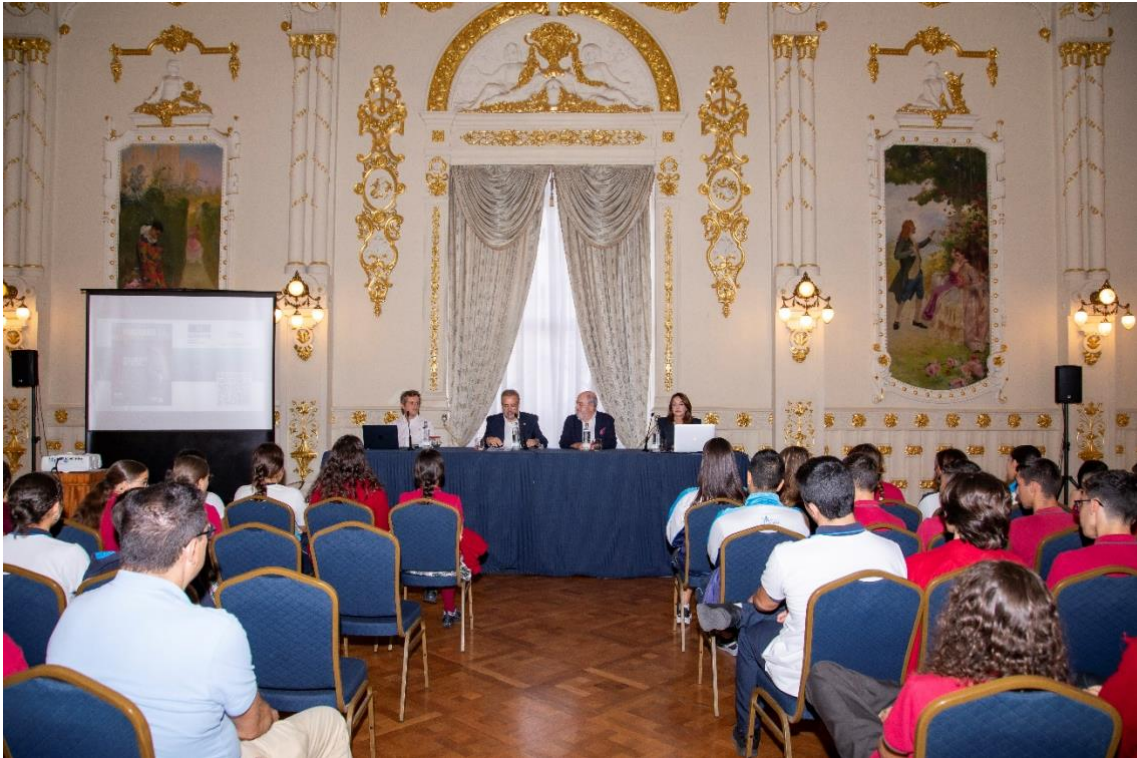
ETICA IA-Presentación del proyecto sobre 'Inteligencia Artificial, Ética y Ciudadanía Consciente' de la Asociación Gran Canaria para la UNESCO (28 de noviembre 2024, en el Gabinete Literario)