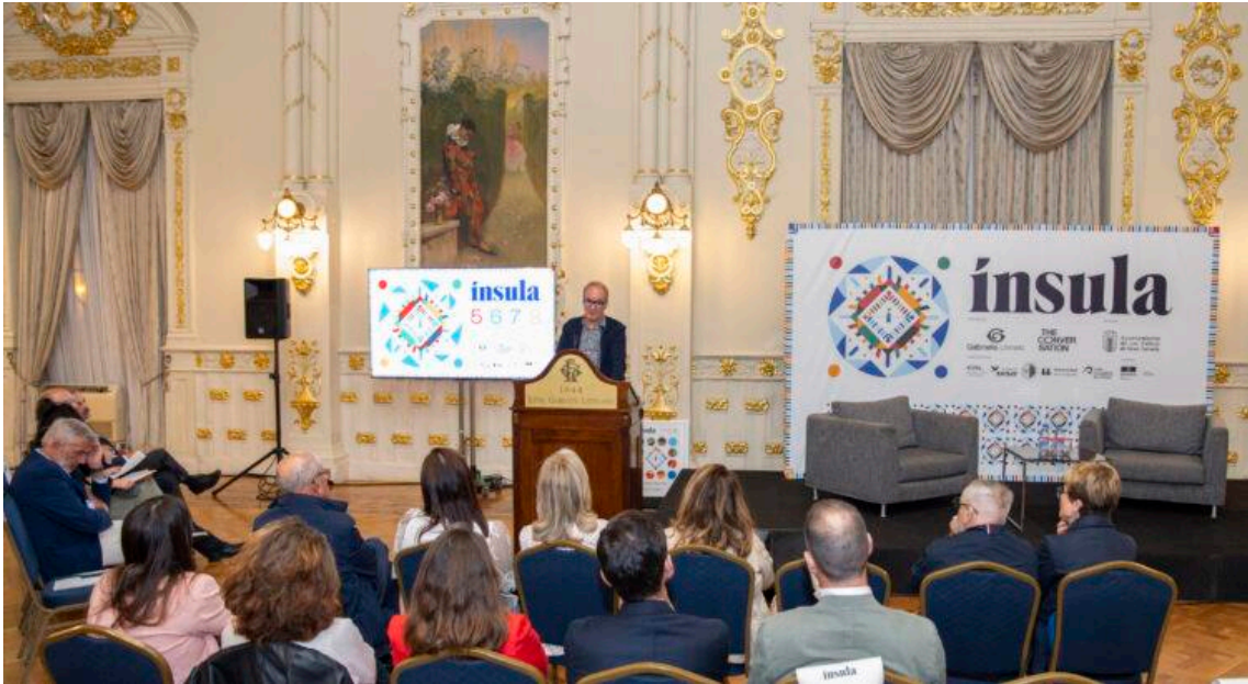
INSULA Conferencia Rafael Rebolo: “Quiero pensar que en otros planetas se han podido dar condiciones para crear vida”