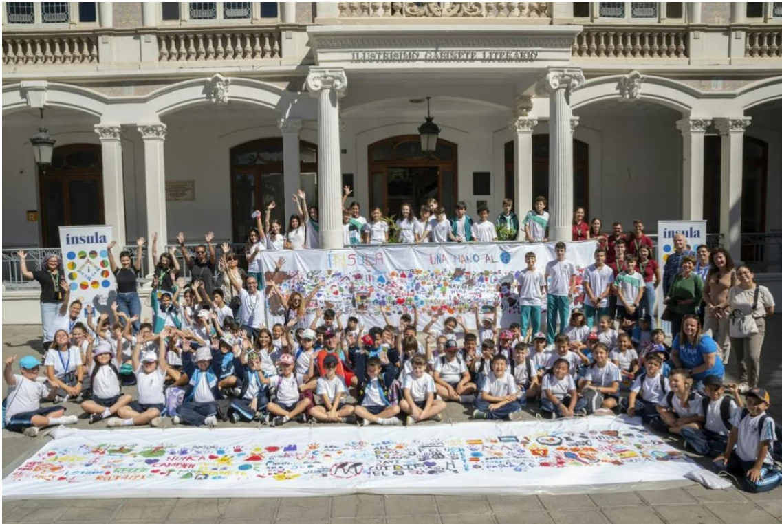
INSULA-La selección: Julio Verne visita ÍNSULA The Conversation -28 de octubre de 2024