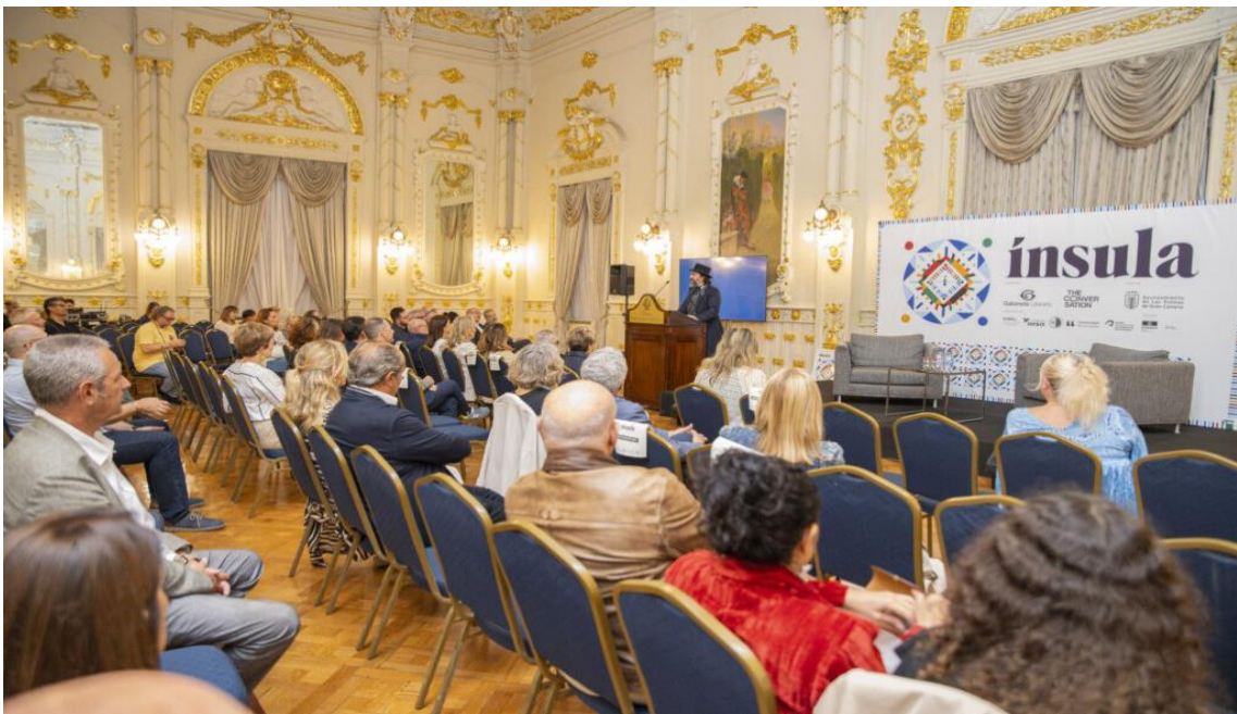
Presentación Proyecto INSULA